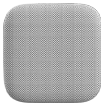
コネクトセンサー