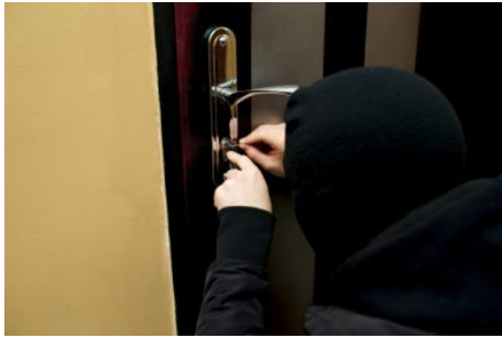
・簡易セキュリティー ドアや窓の開閉をお知らせ