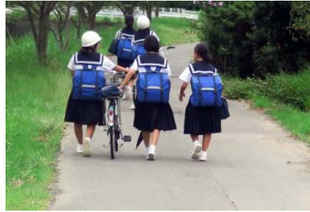
・帰宅確認 子どもの帰宅をお知らせ