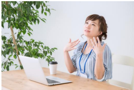
・温度感知（熱中症対策）※2 熱中症の危険がある温度・湿度を感知しお知らせ ※2 お知らせサービスですので、防止することはできません